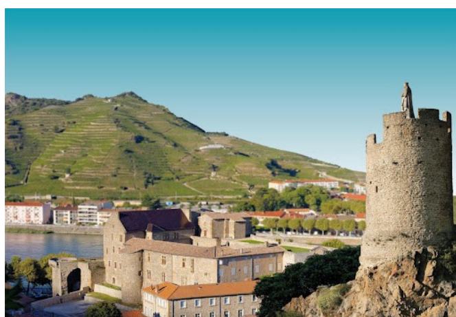
Tournon sur Rhône et son château