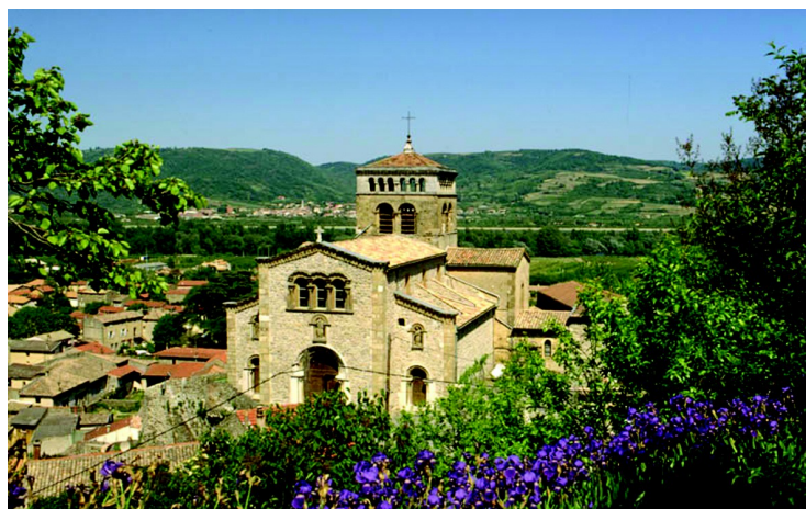
Vion et son église classée