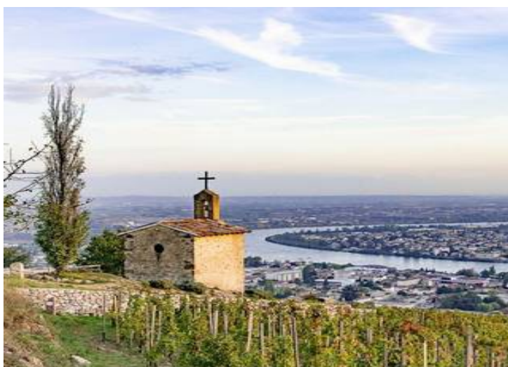
Tain l'Hermitage et sa chapelle

Venez découvrir notre beau patrimoine : Nos vignobles réputés, nos monuments historiques offrant de beaux panoramas sur la vallée du Rhône